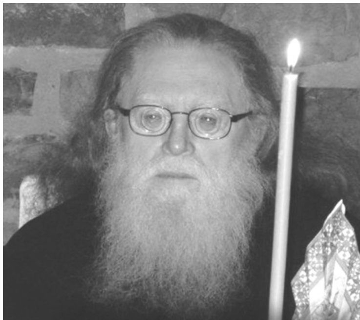
Архимандрит Рафаил (Карелин)

простейших, в которых должны совершаться определённые ритуалы почитания амёбы и других одноклеточных как предков человечества.